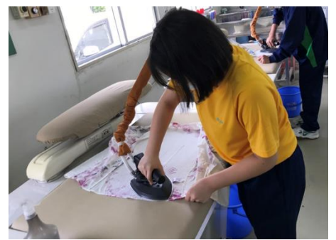
◆ 仕上げ(蒸気アイロン)