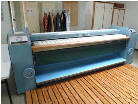
◆ 仕上げ(シャツローラー)