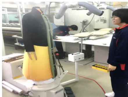
◆ 仕上げ(人体仕上機)