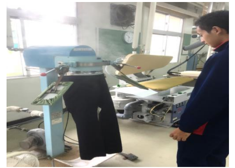
◆ 仕上げ(パンツトッパー)